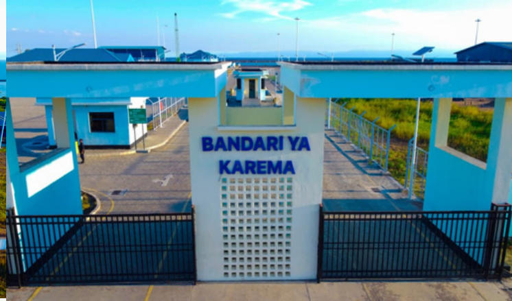
Bandari ya Karema