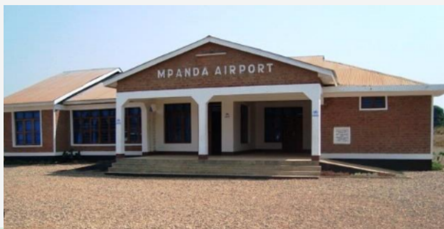
Uwanja wa Ndege wa Mpanda