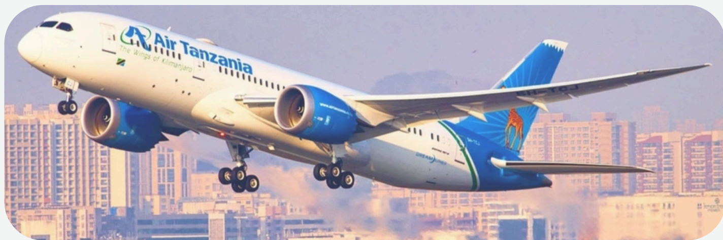
Ndege -Kampuni ya ATCL ambayo hutoa huduma za Usafiri wa Anga

Huduma ya usafiri wa anga Mkoani Katavi ilianza kutolewa tarehe 26 Oktoba 2019, tangu kipindi hicho hadi Februari, 2026 idadi ya wasafiri imeongezeka kutoka 5,721 mwaka 2019 hadi 78,026 Februari, 2026. Idadi ya siku za kusafiri ni mara tatu kwa wiki yaani siku ya Jumanne, Alhamisi na Jumamosi. Kiasi cha fedha kilichokusanywa kimeongezeka toka Tshs.64,274,000.00 mwaka 2019 hadi Tshs. 802,418,616.41 Februari, 2026.