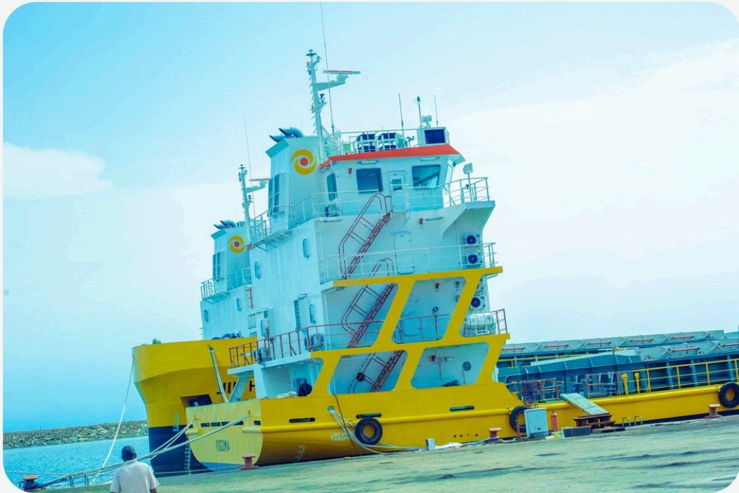
Meli ziliundwa katika Bandari ya Karema